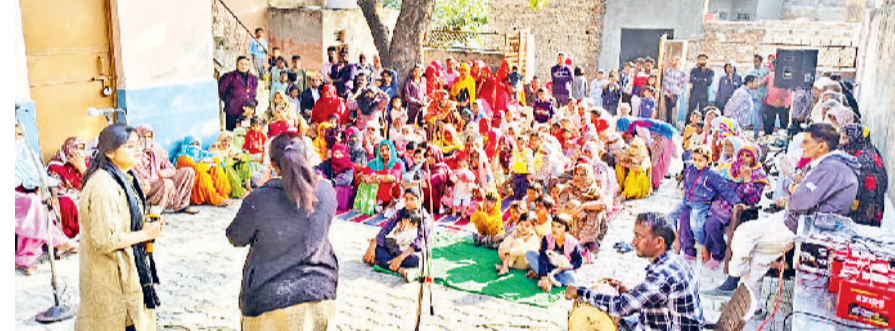
झज्जर। ग्रामीणों के समक्ष नाटक की प्रस्तुति देते हुए संस्था सदस्य।