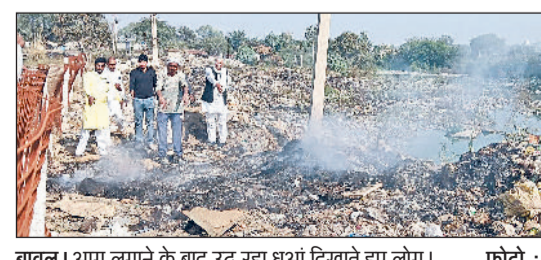
बावल। आग लगाने के बाद उठा हुआ धुआं दिखाते हुए लोग।