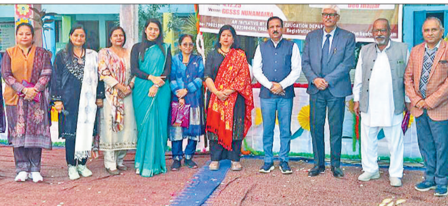
बहादुरगढ़। कार्यक्रम में उपस्थित अधिकारी व शिक्षक।

यात्रा ठहराव कार्यक्रम के माध्यम से विशेषज्ञों ने बताया कि छात्र किस प्रकार तैयारी कर इस विशेष प्रतियोगी प्रशिक्षण का हिस्सा बन सकते हैं। गौरतलब है कि मिशन बुनियाद के माध्यम से अब तक