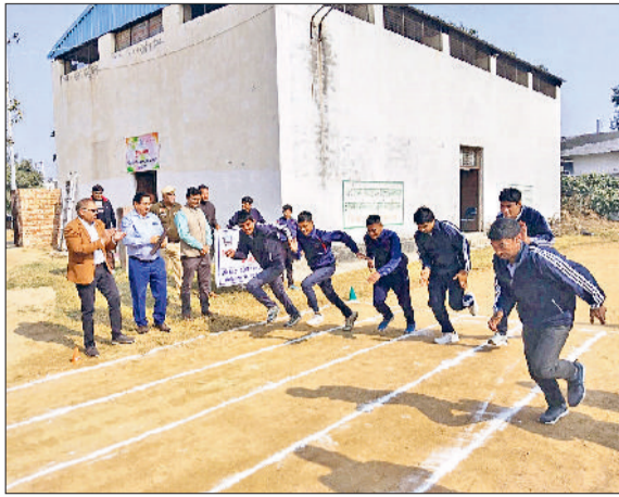
झज्जर। प्रतियोगिता में भाग लेते हुए विद्यार्थी।