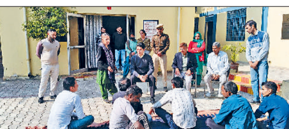
रेवाड़ी। नशा मुक्ति केंद्र में लोगों को जानकारी देते सीजेएम।