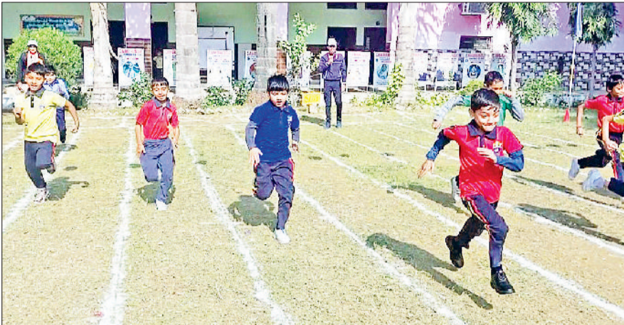
झज्जर। दौड़ प्रतियोगिता में भाग लेते हुए जूनियर विंग के खिलाड़ी।