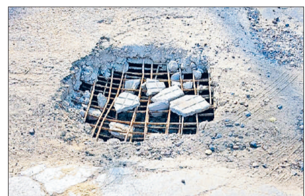
बहादुरगढ़। सेक्टर-13 की एंटी पर क्षतिग्रस्त नाले की पुलिया।

कोने पर नाला भी टूटा पड़ा है। इस कारण वाहन चालक फिसलने और