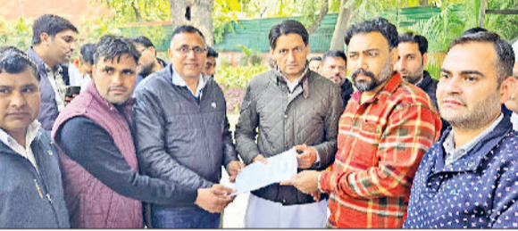
झज्जर। सांसद दीपेंद्र हुड्डा को ज्ञापन देते हुए प्रतिनिधिमंडल सदस्य।

जिले के एक प्रतिनिधिमंडल ने सांसद दीपेंद्र सिंह हुड्डा से उनके दिल्ली निवास पर मुलाकात कर झज्जर जिले को रोहतक डाक प्रभाग से अलग करके नारनौल-महेन्द्रगढ़ डाक प्रभाग में स्थानांतरित करने से स्थानीय लोगों को होने वाली व्यावहारिक परेशानियों के बारे में बताया। सांसद ने केंद्रीय संचार मंत्री के संज्ञान में पूरा मामला लाया और झज्जर जिले को रोहतक डाक प्रभाग में ही पूर्ववत रखते हुए इस प्रस्ताव